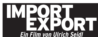
Mater 9 · 45 x 16,5 mm