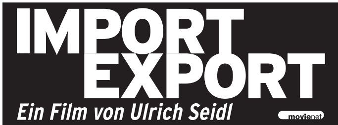
Mater 4 · 90 x 33 mm