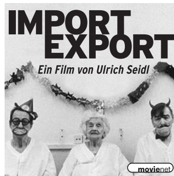
Mater 7 · 45 x 45 mm