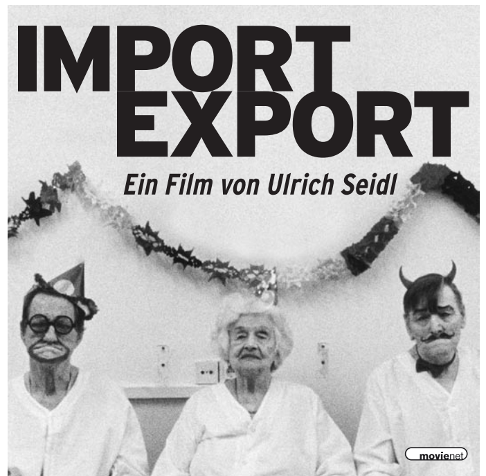
Mater 2 · 90 x 90 mm