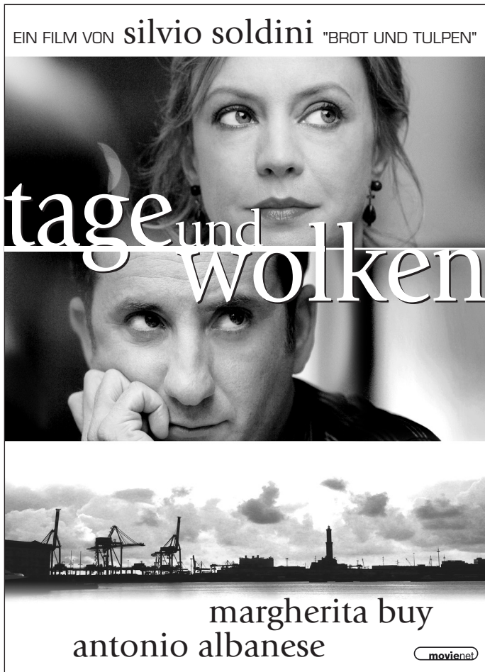
Mater 1 · 90 x 125 mm