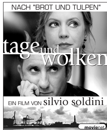
Mater 7 · 45 x 55 mm