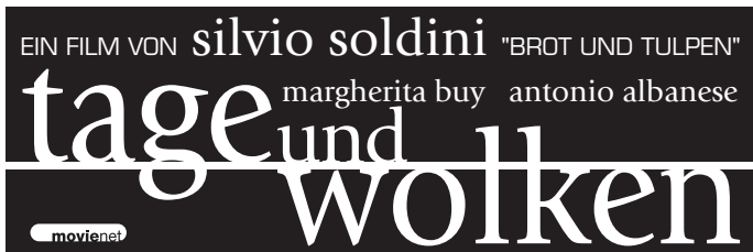
Mater 3 · 90 x 30 mm