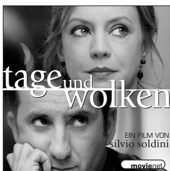
Mater 9 · 45 x 45 mm