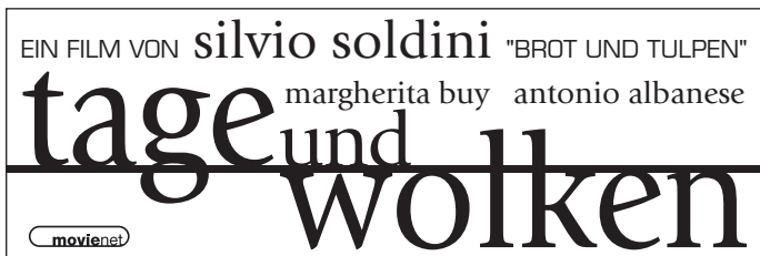
Mater 4 · 90 x 30 mm