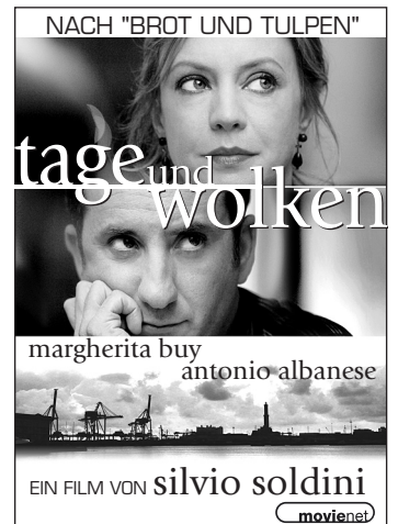
Mater 8 · 45 x 63 mm