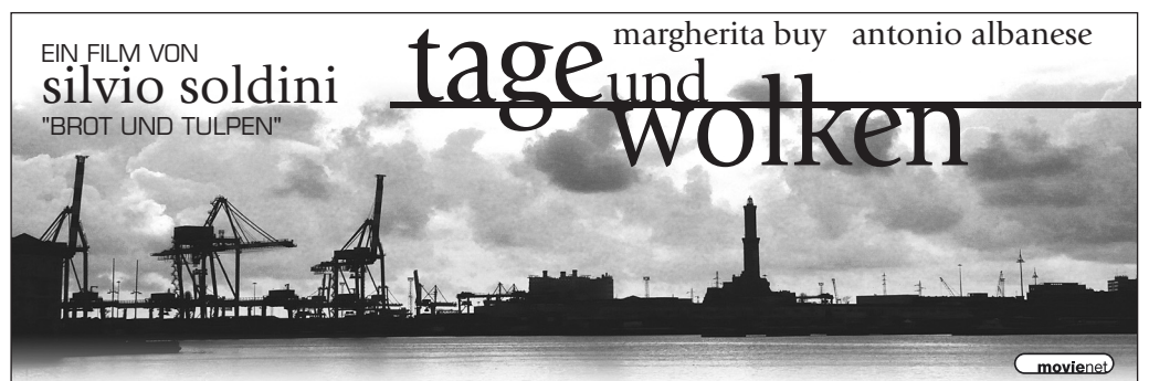
Mater 10 · 135 x 45 mm